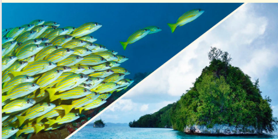
Yap & Palau | Mikronesien 2021